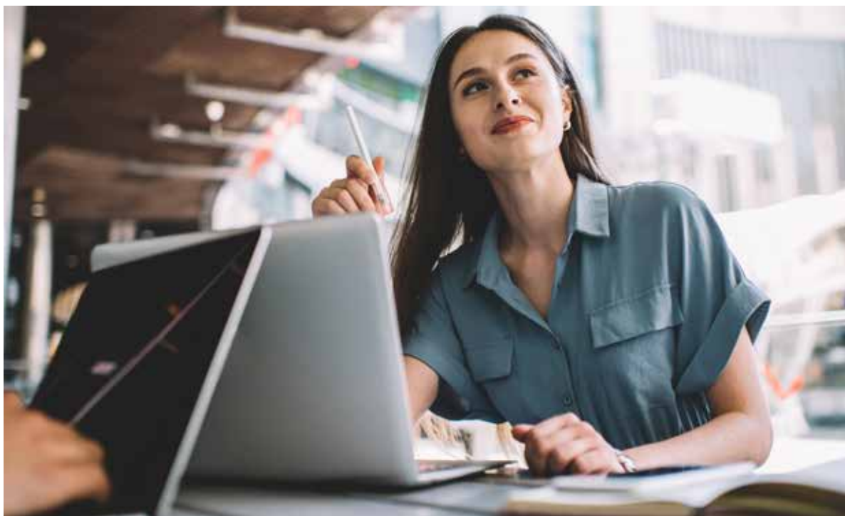
Fot. 29. Współcześnie kobiety coraz lepiej radzą sobie w branży IT