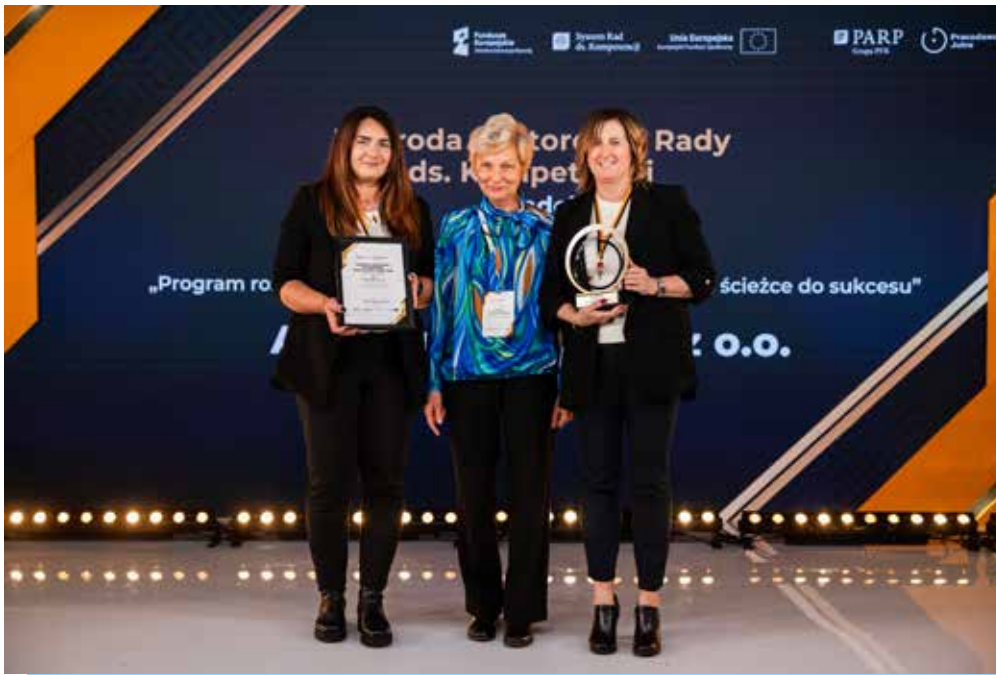
Fot. 2. Wręczenie nagród

Konkurs Pracodawca Jutra od ośmiu lat wyróżnia i promuje tych pracodawców, którzy w sposób świadomy i odpowiedzialny inwestują w ludzi – w ich wiedzę, umiejętności i przyszłość. Celem inicjatywy jest nie tylko nagradzanie, ale przede wszystkim inspirowanie. Chcemy pokazywać, że inwestycja w rozwój pracowników oraz w młode pokolenie wchodzące na rynek pracy to najskuteczniejsza strategia na budowanie odpornej i innowacyjnej gospodarki. Dzięki tym inicjatywom możliwe jest budowanie trwałych relacji między biznesem a edukacją.