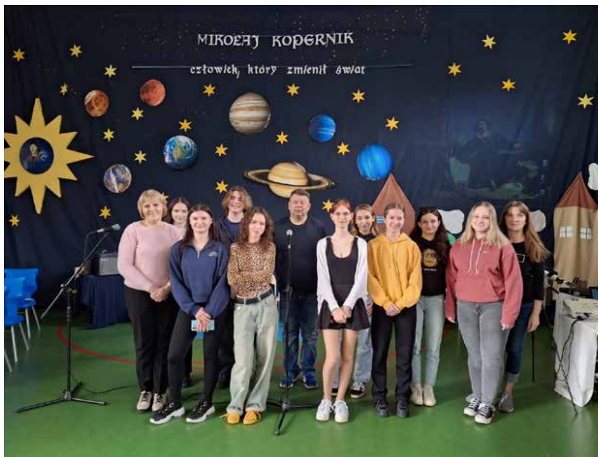
Fot. 34. Zespół Szkół Gastronomiczno-Hotelarskich w Grudziądzu od lat realizuje model nauczania oparty o praktykę, oferujący płatne staże i kursy z udziałem specjalistów

Kluczowe okazało się otwarte podejście pracodawców, którzy nie tylko zadeklarowali gotowość do prowadzenia części zajęć praktycznych w swoich zakładach, ale także zgodzili się na oddelegowanie wykwalifikowanych pracowników do roli instruktorów zawodu. – Bez ich zaangażowania rozpoczęcie programu nie byłoby możliwe – podkreśla Szweda.