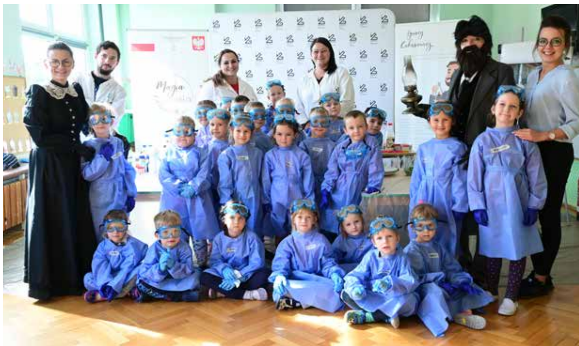
Fot. 23. Projekt umożliwia paniom zdobycie umiejętności niezbędnych w branży IT

Na szczęście coraz więcej inicjatyw biznesowych koncentruje się na wspieraniu młodych kobiet w rozwijaniu kompetencji przyszłości: cyfrowych, analitycznych, projektowych, ale i społecznych, takich jak pewność siebie, komunikacja czy umiejętność budowania relacji w zróżnicowanych zespołach. Jednym z takich przedsięwzięć jest Uniwersytet Sukcesu – program organizowany przez Fundację Digital University w partnerstwie z Nationale-Nederlanden. Projekt wspiera młode kobiety (18-25 lat) ze środowisk wykluczonych, które chcą aktywnie działać w obszarze IT.