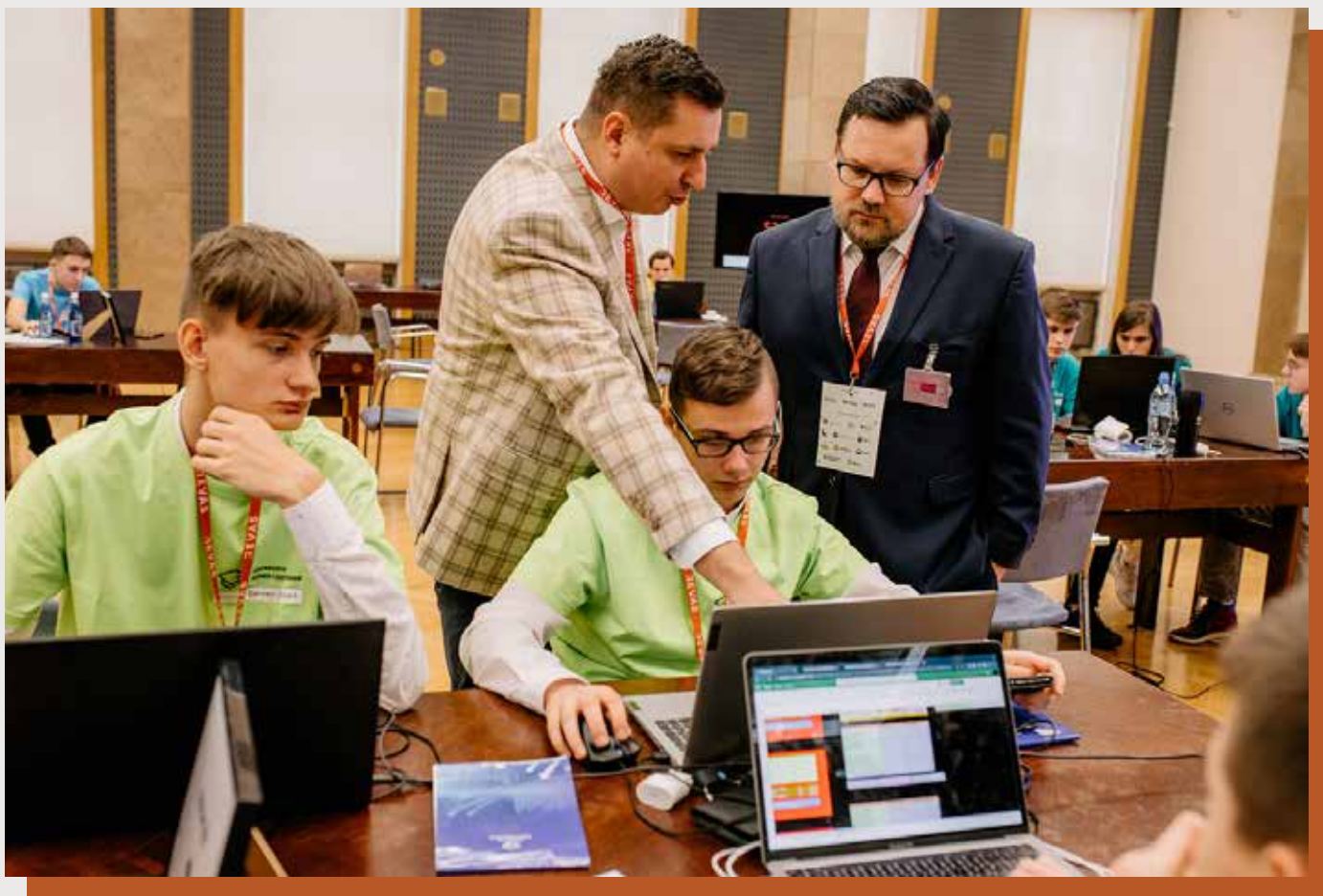
Fot. 4. Uczniowie przez ponad miesiąc prowadzili wirtualne firmy i rywalizowali ze sobą