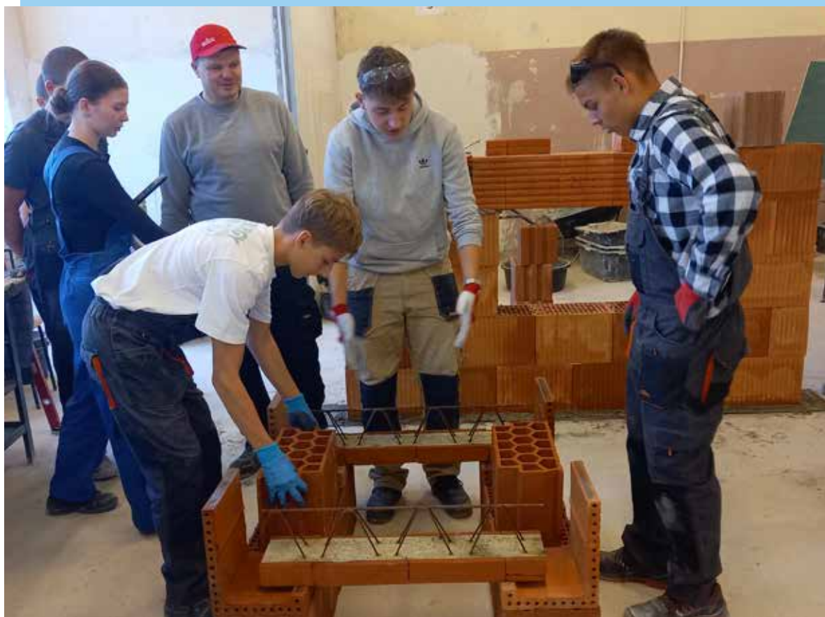
Fot. 19. Aby współpraca biznesu z edukacją była skuteczna, niezbędne jest zaangażowanie, strategiczne podejście i systematyczność