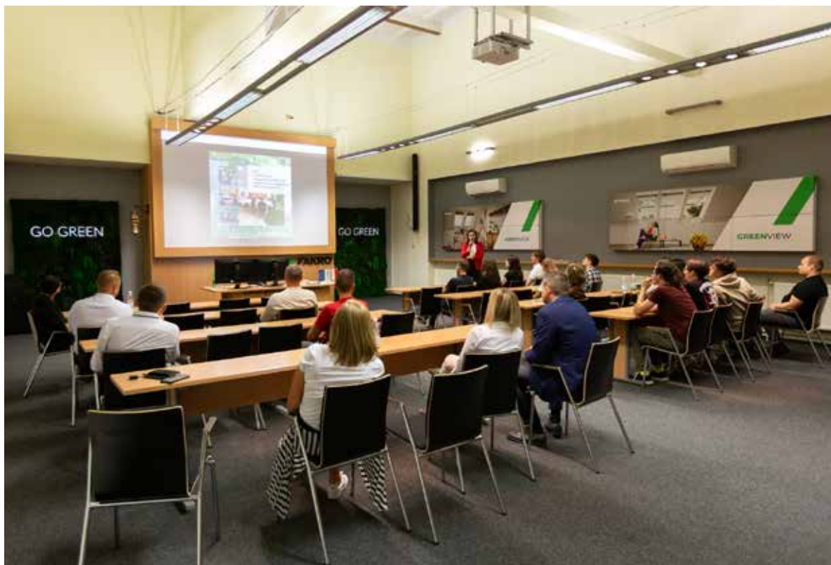
Fot. 16. FAKRO aktywnie współdziała z uczelniami i szkołami o profilu zawodowym, kładąc fundament pod współpracę z przyszłymi absolwentami

Przedsiębiorstwo rozwija także programy wewnętrzne. Ambasador marki FAKRO to inicjatywa od pracowników dla pracowników – zatrudnieni sami zgłaszają swoje koleżanki i kolegów do tytułu ambasadora. Firma nagradza przede wszystkim postawy otwartości, gotowość do współpracy i promowanie zakładu także po godzinach. Popularnością cieszy się również program zgłaszania pomysłów „Zielone Punkty”, w ramach którego pracownicy są wyróżniani za kreatywność, a najlepsze pomysły i udoskonalenia wprowadzane są w życie.