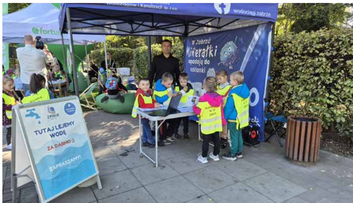
Fot. 27. Zabrzeńskie Przedsiębiorstwo Wodociągów i Kanalizacji swoich działań nie ogranicza do przedszkoli i szkół. Pracownicy prowadzą też spotkania i prelekcje, a stoisko firmy można znaleźć na miejskich imprezach