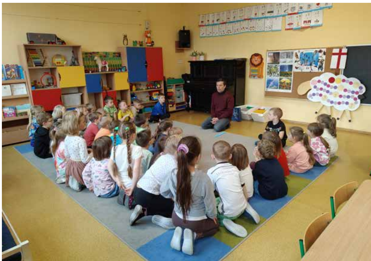
Fot. 26. Zgodnie z ideą – dzieci, które uczą się dziś o tym, czym są zasoby wodne i jak o nie dbać, w przyszłości same będą inicjowały pozytywne zmiany

Kampanie obejmują plakaty, ulotki, media, a przede wszystkim spotkania i prelekcje. Zabrzańskie wodociągi są też obecne ze swoim stoiskiem na wielu wydarzeniach miejskich.