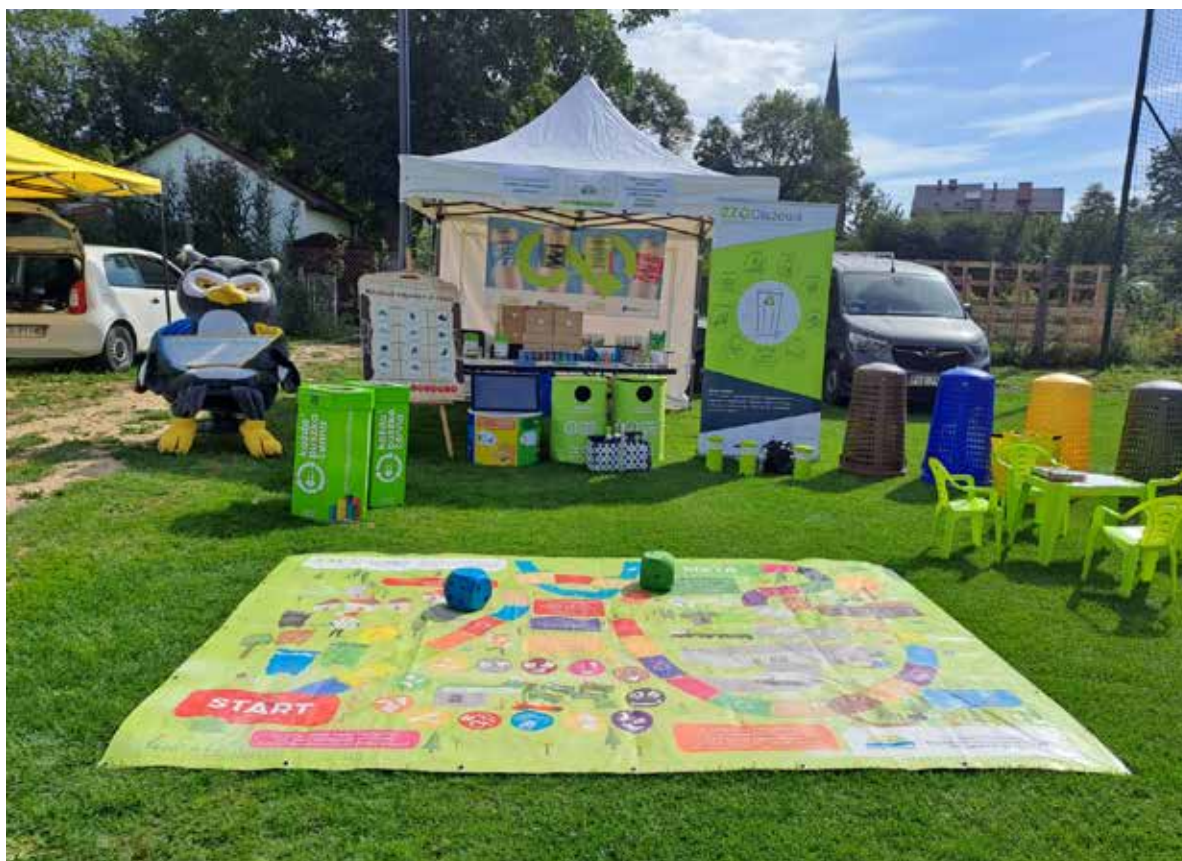
Fot. 42. Edukatorzy wyjaśniają nie tylko jak działa segregacja. Udowadniają też, że każdy z nas ma ogromny wpływ na gospodarowanie odpadami, a zatem i na środowisko

nagroda w sektorze odzysku materiałowego surowców za inicjatywę edukacyjną „Kształtowanie świadomości i odpowiedzialności ekologicznej w zakresie racjonalnej gospodarki odpadami i ochrony otaczającego środowiska poprzez prowadzenie warsztatów edukacyjno-informacyjnych, konkursów, profili w mediach społecznościowych, dystrybucję materiałów, promocję filmów edukacyjnych dla mieszkańców 13 gmin udziałowców ZZO Olszowa Sp. z o.o. tj. Baranów, Bralin, Doruchów, Dziadowa Kłoda, Kępno, Łęka Opatowska, Międzybórz, Oleśnica, Miasto Oleśnica, Perzów, Rychtal, Syców oraz Trzcinica”