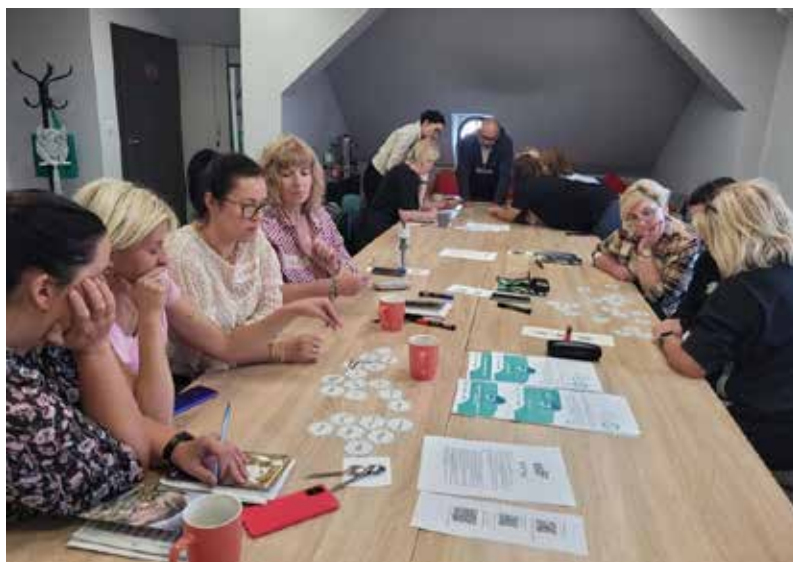
Fot. 41. W drugiej edycji projektu wzięło udział ponad 50 tys. uczestników