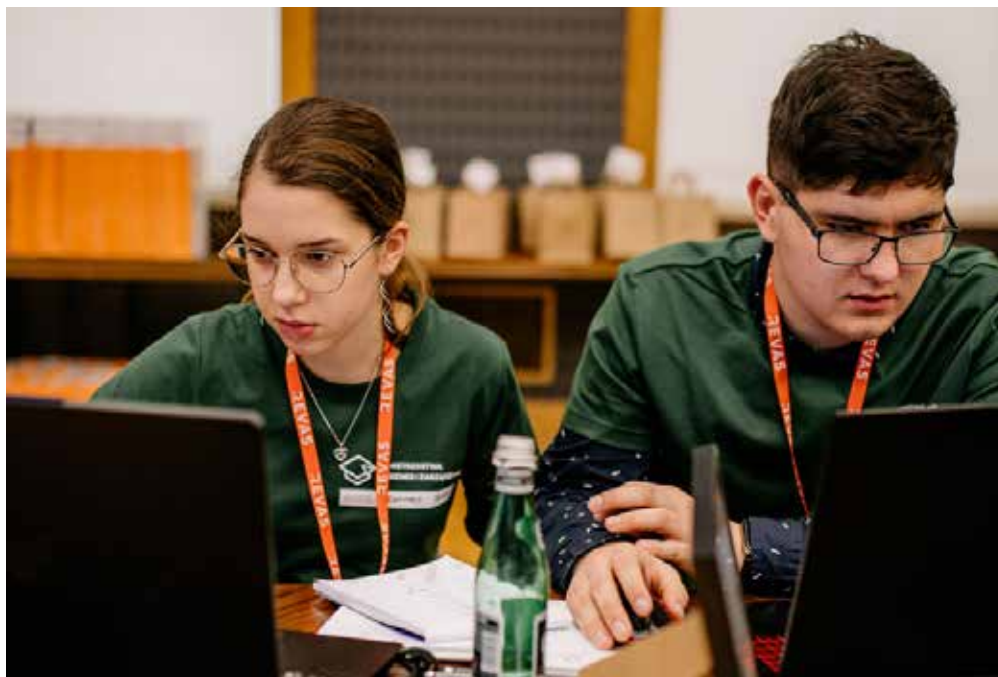
Fot. 6. W pierwszej edycji konkursu udział wzięły 193 szkoły. W drugiej, w 2024 roku, już ponad 400

Uczestnicy mistrzostw przez ponad miesiąc zarządzają wirtualną firmą, biorąc udział w internetowej symulacji odzwierciedlającej realne warunki rynkowe. Pracując w zespołach, podejmują decyzje dotyczące oferty, inwestycji, zatrudnienia, sprzedaży i marketingu – a ich działania wpływają na wspólny rynek, na którym konkurują z innymi drużynami. To właśnie ten element rywalizacji nadaje projektowi dynamikę i pozwala lepiej zrozumieć zależności między decyzjami biznesowymi. Do finału trafia dziewięć zespołów z najlepszymi wynikami. Pod uwagę branych jest pięć kryteriów: efektywność ekonomiczna, rozwój firmy, poziom zadłużenia oraz zadowolenie klientów i pracowników. W pierwszej edycji konkursu wzięły udział 193 szkoły, w 2024 roku – już ponad 400.