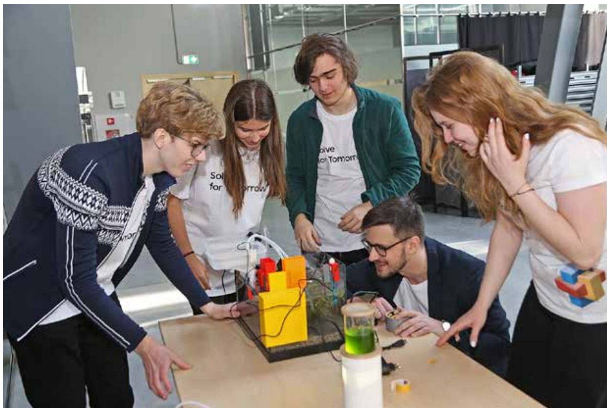
Fot. 45. Samsung Electronic Polska, współpracując z młodzieżą, poznaje oczekiwania swoich przyszłych pracowników