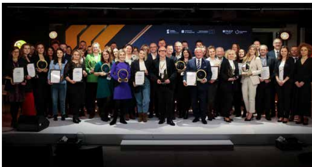
Fot. 3. Laureaci konkursu

– Konkurs Pracodawca Jutra to przede wszystkim inspiracja. Pokazujemy, że inwestycja w ludzi, ich rozwój i edukację to najlepsza strategia na przyszłość. Laureaci konkursu dowodzą, że odpowiedzialny biznes może i powinien współtworzyć nowoczesny, kompetentny rynek pracy. Cieszy nas, że tak wiele firm podejmuje wyzwanie i staje się liderami zmian – mówi Krzysztof Gulda, p.o. prezesa Polskiej Agencji Rozwoju Przedsiębiorczości.