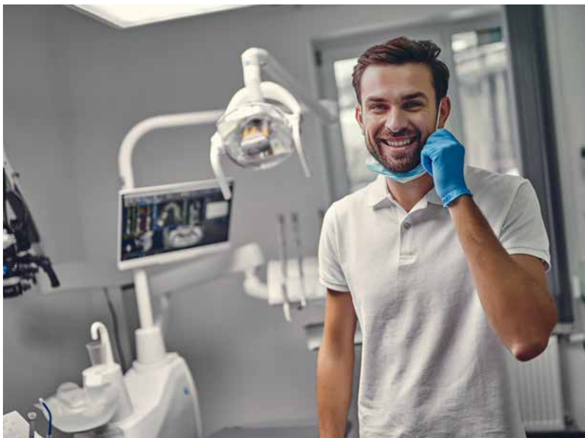
Fot. 44. Poprawa wiedzy na temat zdrowia jamy ustnej i wzmocnienie profilaktyki – to główne cele przedsięwzięcia

Promocja zdrowia rozpoczyna się od świadomej edukacji, szczególnie ukierunkowanej na potrzeby najbardziej wrażliwych grup społecznych. Dzieci, osoby z niepełnosprawnościami oraz zagrożone wykluczeniem społecznym wymagają rozwiązań, które przekazują wiedzę i umożliwiają jej praktyczne wykorzystanie w życiu codziennym.