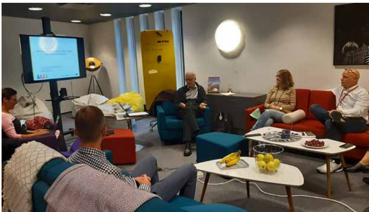
Fot. 51. Wyjątkowość projektu polega na połączeniu polskiej praktyki i fińskiej metodologii

modelowaniu środowiska pracy. Skierowane jest do pracodawców oraz osób w wieku przedemerytalnym i emerytalnym. Dzięki niemu użytkownicy aktywnie dostosowują swoje obowiązki, relacje zawodowe oraz sposób myślenia o pracy do tego, aby jak najlepiej odpowiadały ich indywidualnym potrzebom, umiejętnościom i wartościom.