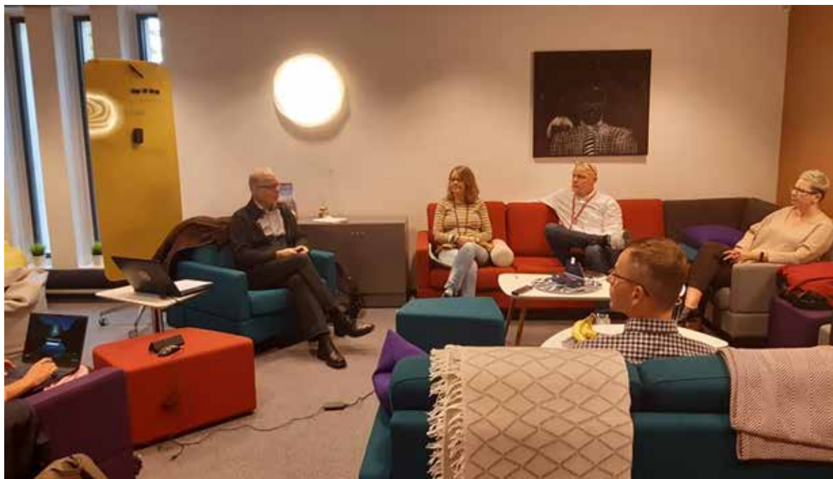
Fot. 50. Firma Inspire Consulting Sp. z o.o. dostrzega potencjał osób po 50. roku życia i wspiera je na rynku pracy