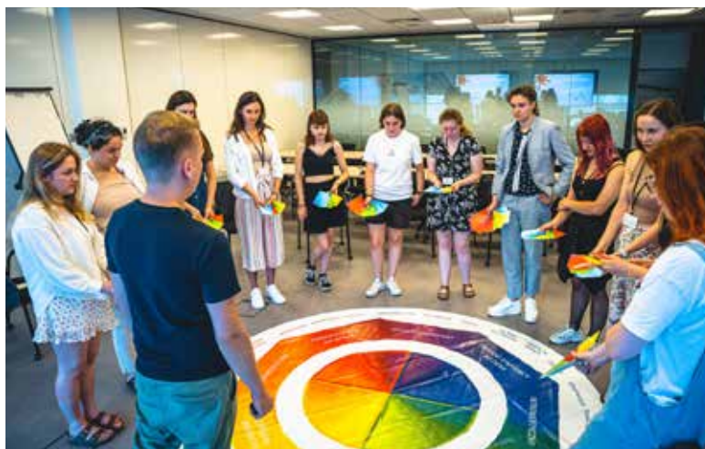
Fot. 24. Obecnie trwa siódma edycja projektu. Łącznie, jak dotąd, ze wsparcia skorzystało ponad 400 uczestniczek