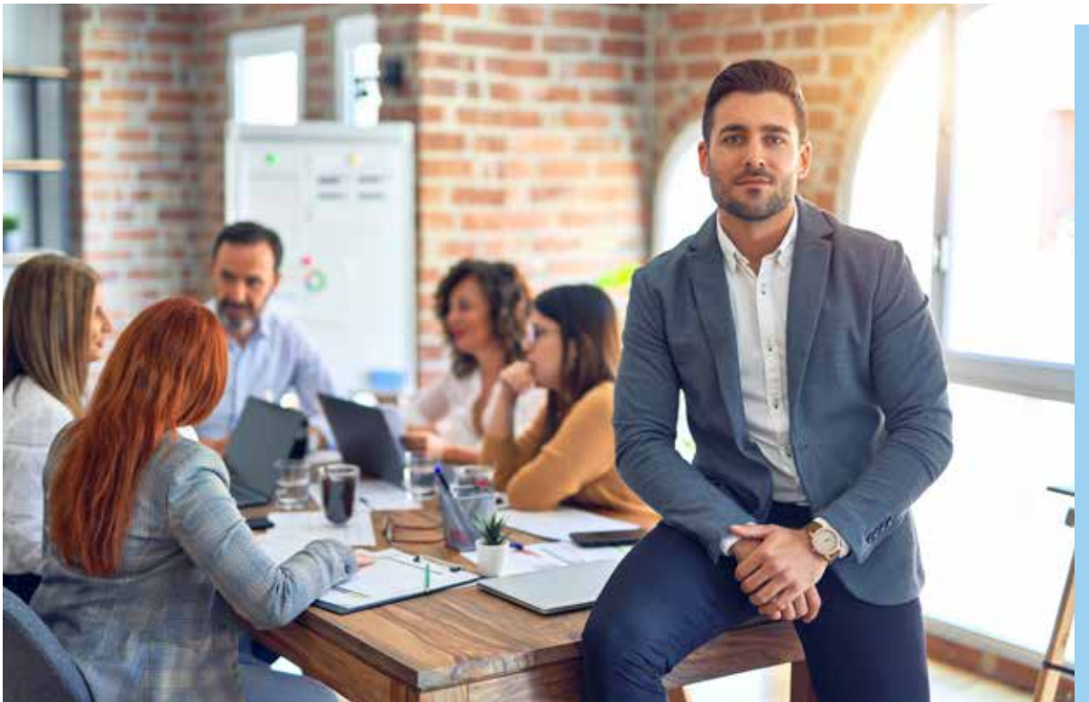
Fot. 53. Rozwój pracowników jest bardzo ważny dla firmy Hochland Polska

Ważnym elementem polityki szkoleniowej firmy była Akademia „First Time Line Manager”. Program miał na celu kompleksowe przygotowanie nowo mianowanych liderów oraz kandydatów do objęcia ról kierowniczych. Uczestnicy dotychczasowych dwóch edycji programu to pracownicy z obszaru produkcji, działu technicznego, magazynów