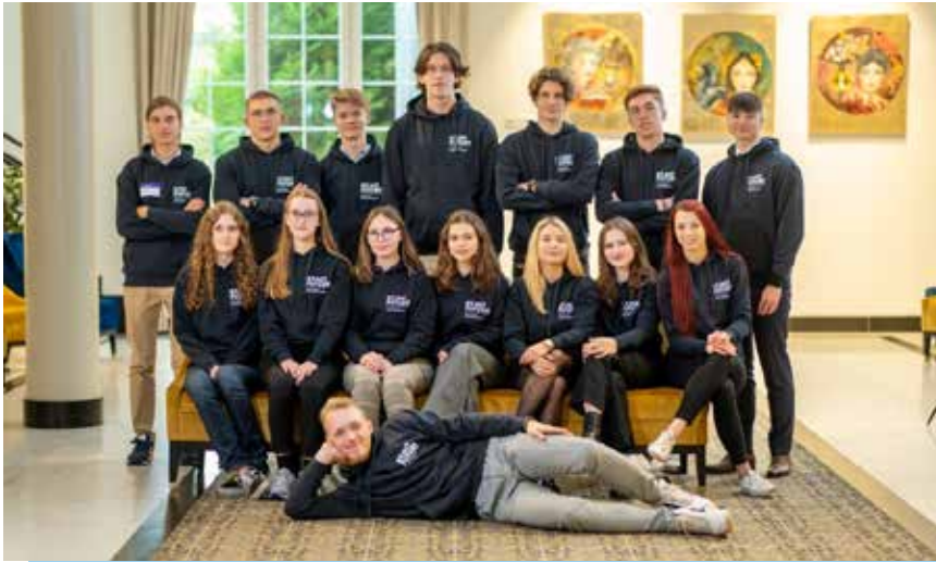
Fot. 36. Uczestnicy programu stypendialnego Exact Systems