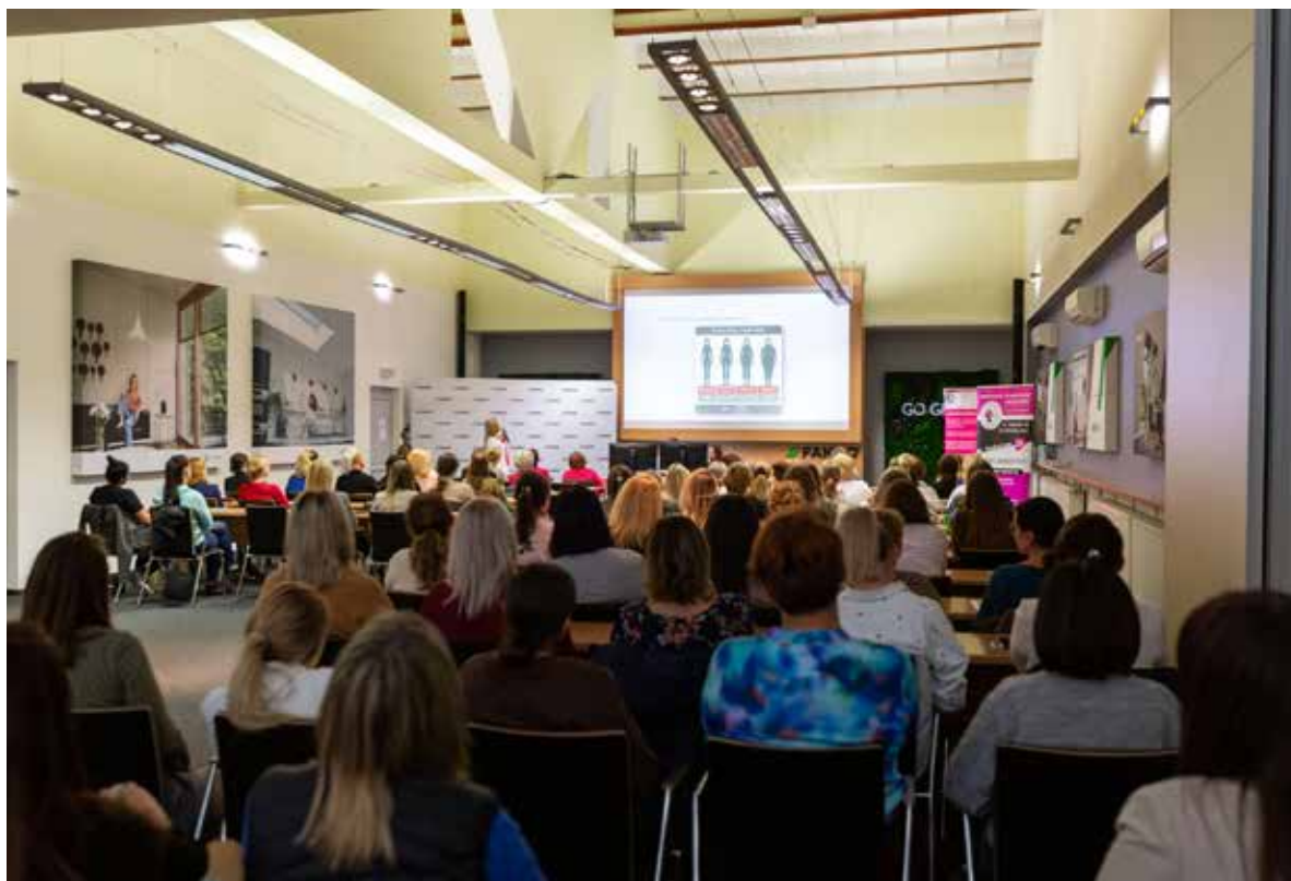
Fot. 15. Firma od lat kładzie duży nacisk na rozwój pracowników. To oni nadają bowiem rytm inwestycjom i budują relacje z klientami

osób – zarówno z umiejętności miękkich, jak i technicznych, od obsługi nowych urządzeń i programów po zaawansowane technologie – dodaje.