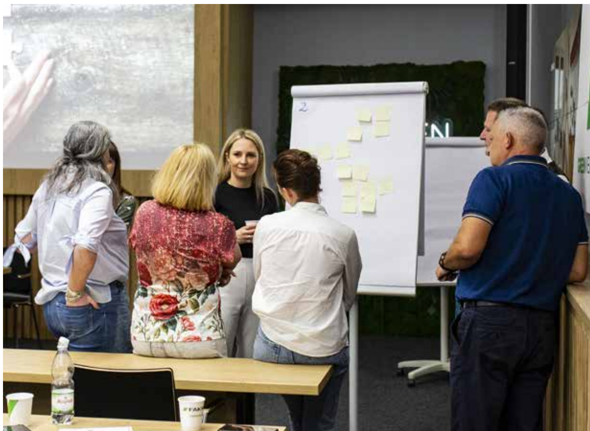
Fot. 14. Na współczesnym rynku pracy inwestowanie w rozwój kadr daje przewagę konkurencyjną (fot. archiwum laureata)