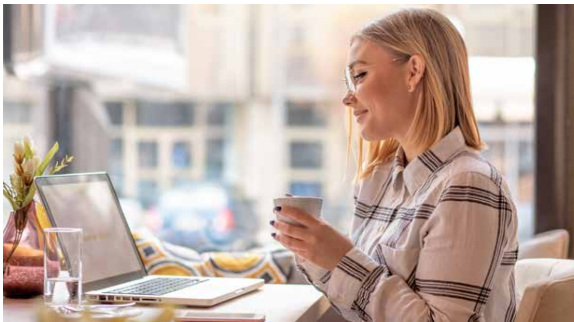
Fot. 30. Capgemini swoje działania kieruje do uczennic szkół średnich. Mogą się nauczyć m.in. podstaw programowania, doradztwa IT czy zarządzania projektami

zawodowego. Firma, będąca światowym liderem w doradztwie technologicznym i transformacji biznesowej, zainicjowała program „IT Girls rEvolution Academy” skierowany do uczennic szkół średnich. Jego celem jest wyrównywanie szans w zatrudnieniu w branży IT, zwłaszcza w zawodach technicznych, gdzie nadal występują różnice ze względu na płeć. Program promuje ideę różnorodności i integracji, oferując równy dostęp do wiedzy i możliwości.