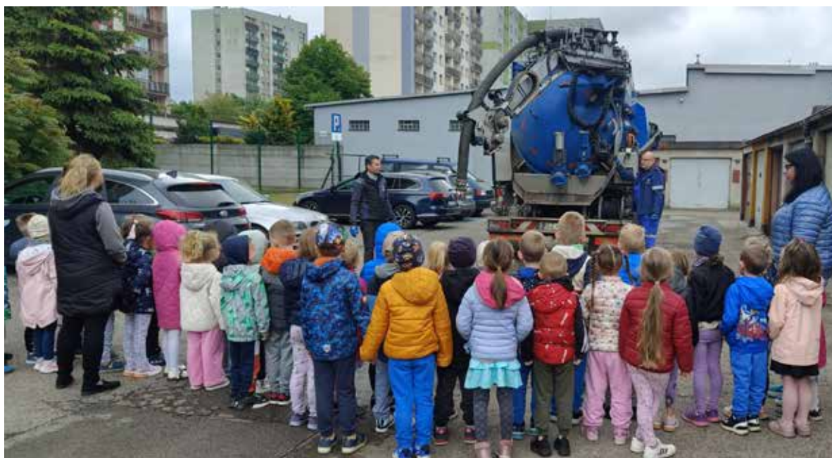
Fot. 25. Zabrzańskie Przedsiębiorstwo Wodociągów i Kanalizacji mocno angażuje się w edukację ekologiczną

Już sześć lat temu ZPWik jako jeden z pierwszych zakładów wodociągowych w kraju rozpoczął systemowe działania edukacyjne.