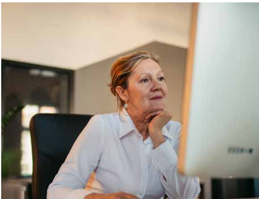
Fot. 11. Pracownicy w wieku powyżej 50 lat dysponują doświadczeniem, które dla pracodawców bywa bezcenne