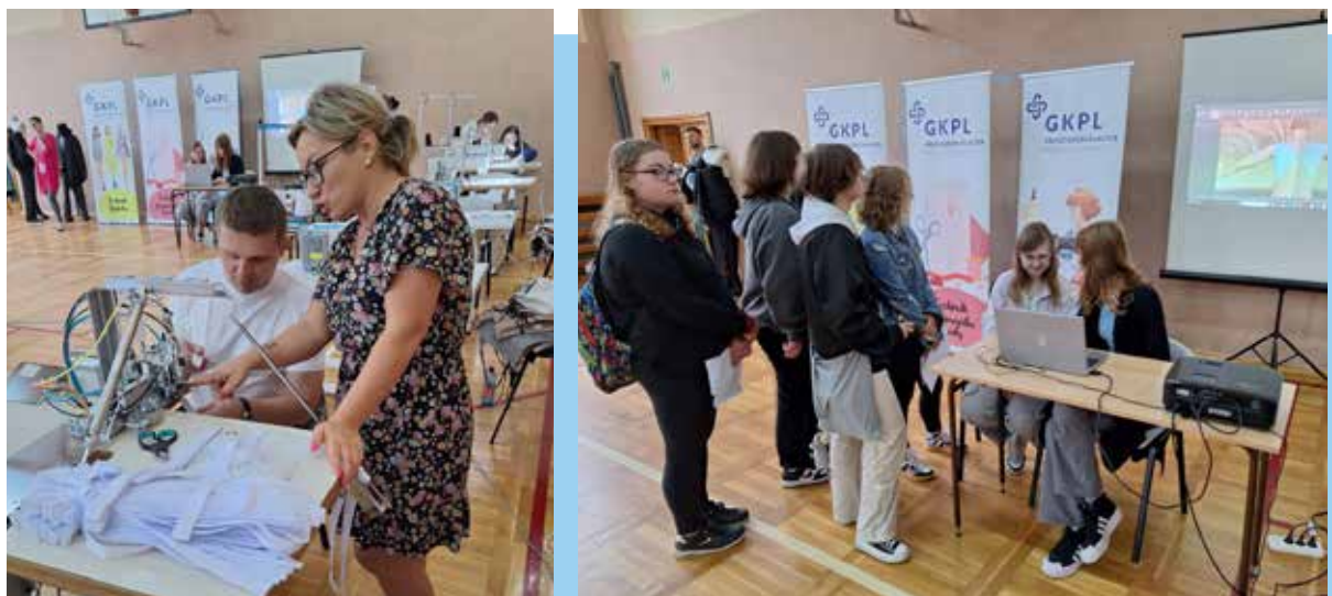
Fot. 35. W klasach odzieżowych uczy się dziś przeszło 100 uczniów

Z jego doświadczenia wynika jasno: udana współpraca między edukacją a biznesem wymaga otwartości i elastyczności po obu stronach. – Nazywając to po imieniu – szkoły nie mają wyobrażenia, w jakiej rzeczywistości funkcjonują firmy, natomiast przedsiębiorcy nie orientują się, jak skomplikowane procedury i bariery występują po stronie szkół. Warunkiem koniecznym do owocnej współpracy jest chęć wzajemnego zrozumienia.