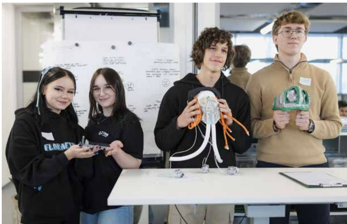
Fot. 47. Projekt skierowany jest do uczniów szkół ponadpodstawowych