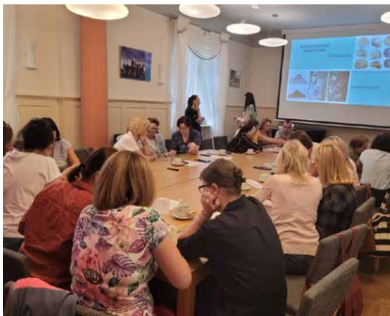
Fot. 40. Deloitte Polska nie tylko stawia na zrównoważony rozwój, ale chętnie wspiera edukację ekologiczną

Program Be.Eco obejmuje webinary i warsztaty dla nauczycieli, prowadzone przez ekspertów, którzy dzielą się wiedzą na temat pracy z młodzieżą i kształtowania proekologicznych postaw w środowisku szkolnym. Pedagodzy mają dostęp do bezpłatnej platformy edukacyjnej z materiałami dydaktycznymi oraz certyfikatem potwierdzającym zdobyte kompetencje. Program oferuje także gotowe scenariusze zajęć, konkurs filmowy dla uczniów, turniej wiedzy ekologicznej z grantami dla szkół oraz ekowyzwania promujące ideę gospodarki cyrkularnej i stylu życia zero waste.