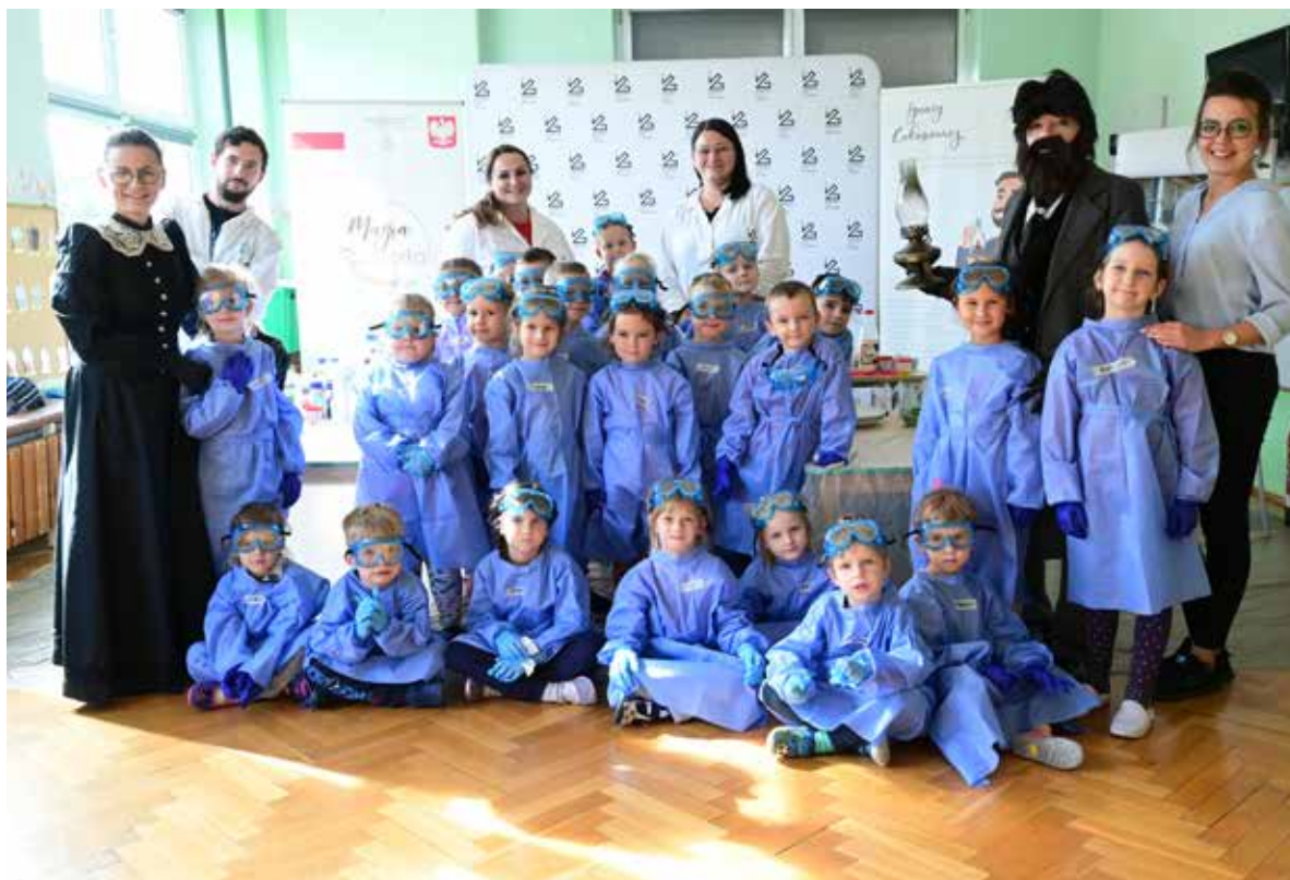
Fot. 20. Rozwijanie pasji u najmłodszych może okazać się kluczem w przyszłości, przy wyborze ścieżki edukacyjnej i zawodu