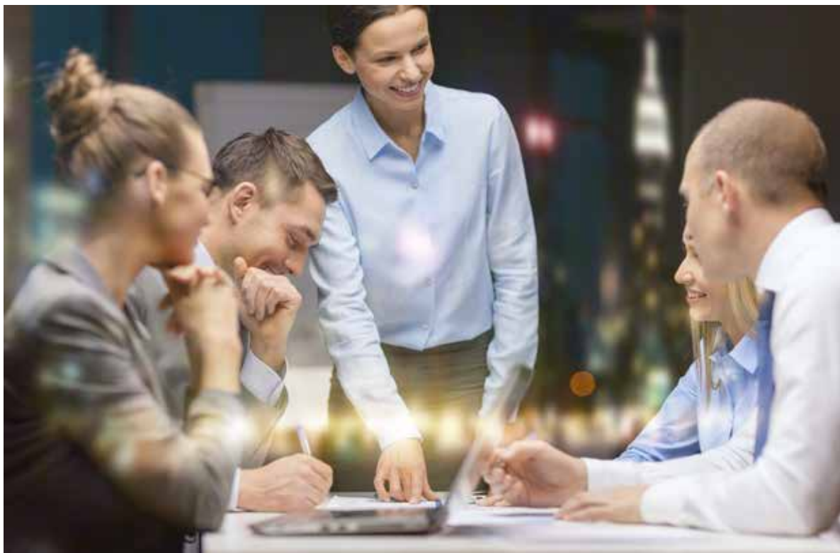
Fot. 52. Współcześnie ważne jest, aby edukacja i podnoszenie wiedzy były nie epizodem, a stałym elementem kultury organizacyjnej firmy