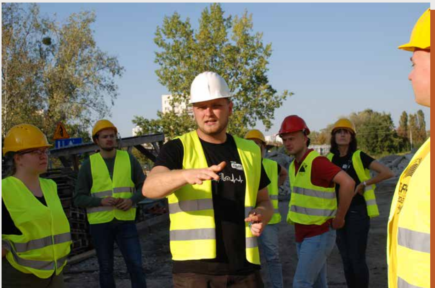
Fot. 17. Dla grupy RISER, działającej w branży budowlanej, współpraca z sektorem edukacyjnym jest na wagę złota