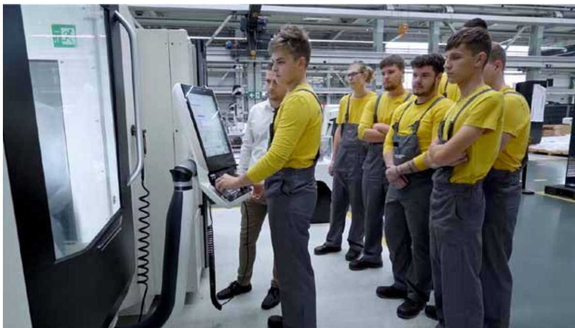
Fot. 9. Uczniowie kształcą się w zawodach deficytowych, m.in. operatora obrabiarek CNC

– Kluczem do sukcesu była partnerska współpraca i wspólne tworzenie programów nauczania łączących teorię z praktyką – dodaje Izabela Spiżak. – Równie ważne było zapewnienie dostępu do technologii, z jakimi uczniowie będą pracować w przyszłości. Dzięki temu budujemy trwałe relacje między szkołą a firmą.