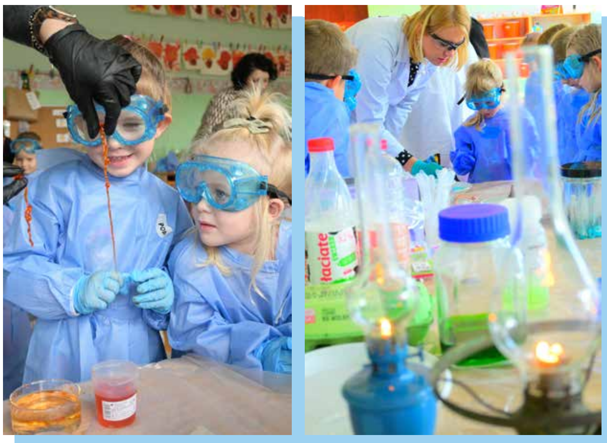
Fot. 21. Sieć Badawcza Łukasiewicz Instytut Ciężkiej Syntezy Organicznej „Blachownia” zaprosił najmłodszych na warsztaty chemiczne