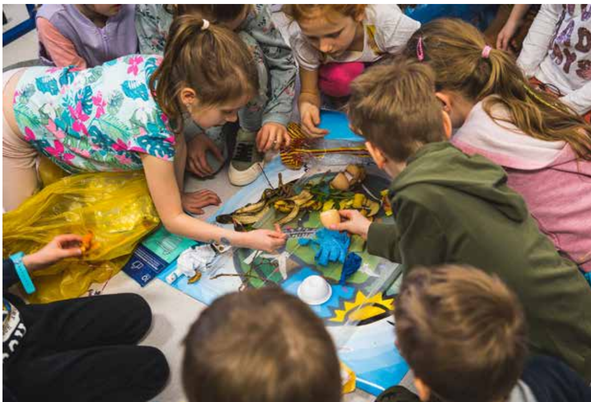
Fot. 39. Budowanie świadomości ekologicznej od najmłodszych lat ma kluczowe znaczenie