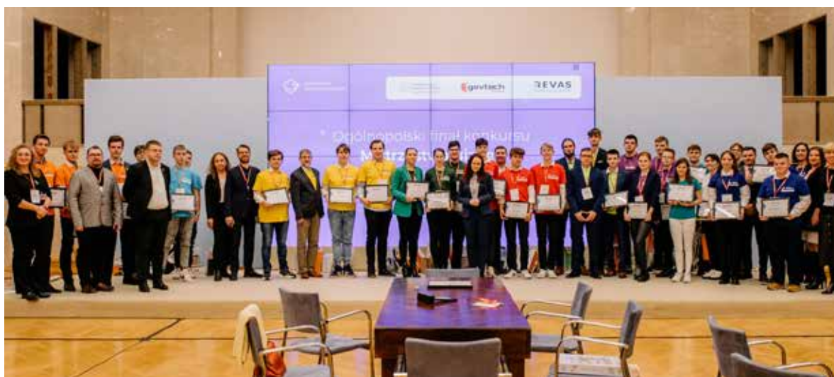
Fot. 5. Uczestnicy konkursu „Mistrzostwa Biznes i Zarządzanie”

Edukacja biznesowa staje się coraz ważniejszym elementem przygotowania młodzieży do życia zawodowego. Znajomość podstaw przedsiębiorczości, zarządzania i finansów daje uczniom przewagę – nie tylko na rynku pracy, lecz także w codziennych wyborach. Rzeszowska spółka Revas od lat rozwija autorskie narzędzia edukacyjne. Jej flagowym projektem jest ogólnopolski konkurs oparty na Branżowych Symulacjach Biznesowych „Mistrzostwa Biznes i Zarządzanie”. Uczniowie szkół ponadpodstawowych zarządzają wirtualnymi firmami i rywalizują ze sobą w warunkach zbliżonych do rzeczywistego rynku.