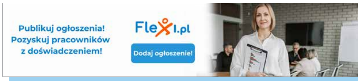
Fot. 13. To pierwsza w Polsce platforma, która w pełni odpowiada na potrzeby dotyczące rynku pracy osób po 50. roku życia