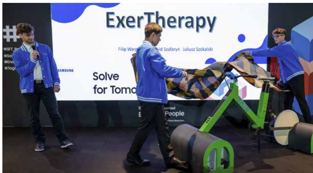
Fot. 46. Myślenie projektowe, współpraca i odpowiedzialność społeczna to cechy, które należy wykształcić u współczesnego młodego pokolenia

Przedsięwzięcie adresowane jest do uczniów szkół ponadpodstawowych, którzy podejmują próbę mierzenia się z wyzwaniami współczesnego świata – od ochrony zdrowia, poprzez problemy klimatyczne i zagadnienia bezpieczeństwa, aż po integrację społeczną. Proces edukacyjny rozpisany jest na kilka etapów, z których każdy służy rozwijaniu umiejętności projektowych i społecznych. Pierwszym krokiem jest zgłoszenie pomysłów i rozwiązań