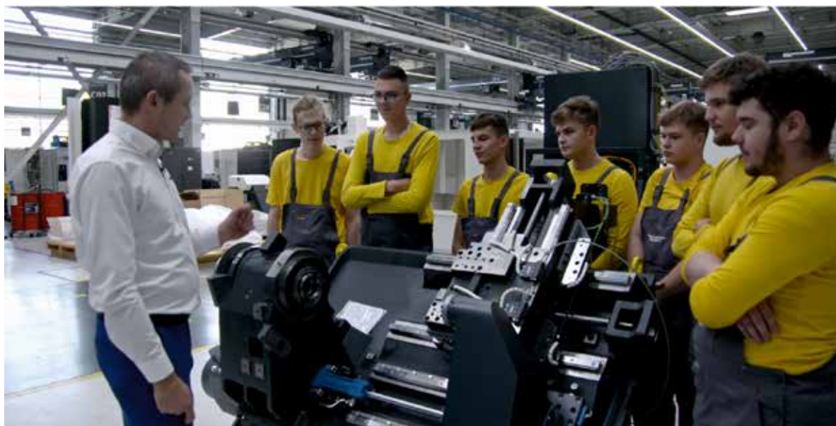
Fot. 8. Firma, we współpracy z samorządem, utworzyła w dwóch lokalnych szkołach klasy patronackie