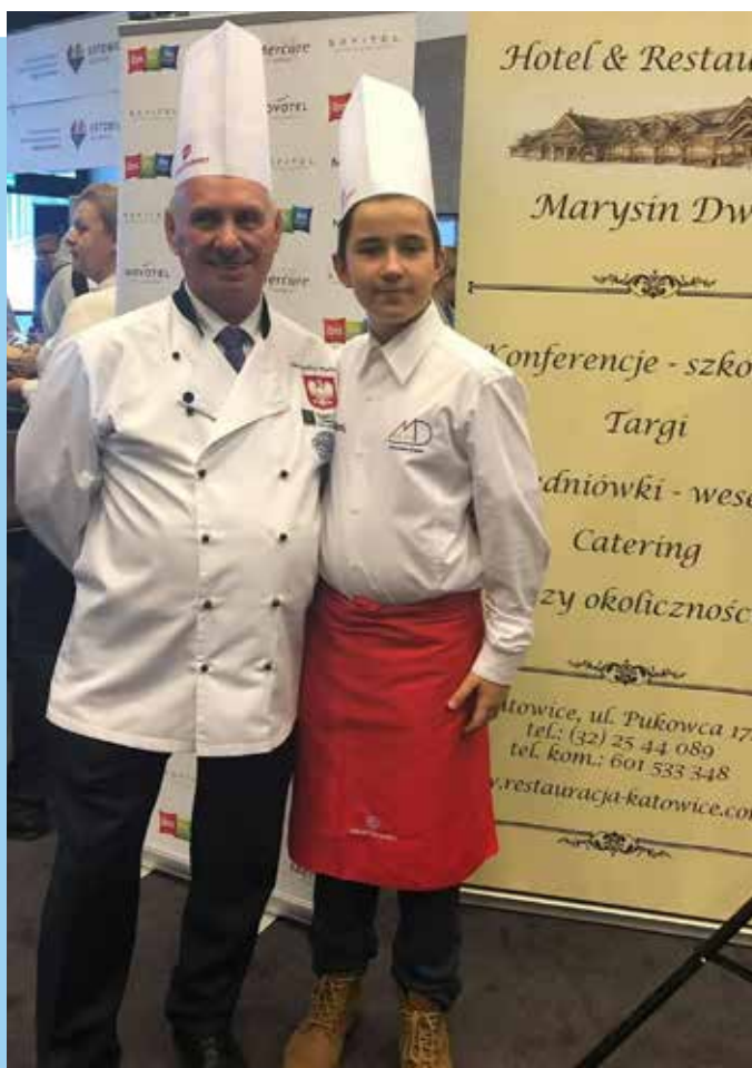
Fot. 49. Pierwsze zawodowe doświadczenia, zdobyte jeszcze w szkole, są bezcenne w kontekście przyszłego wejścia na rynek pracy