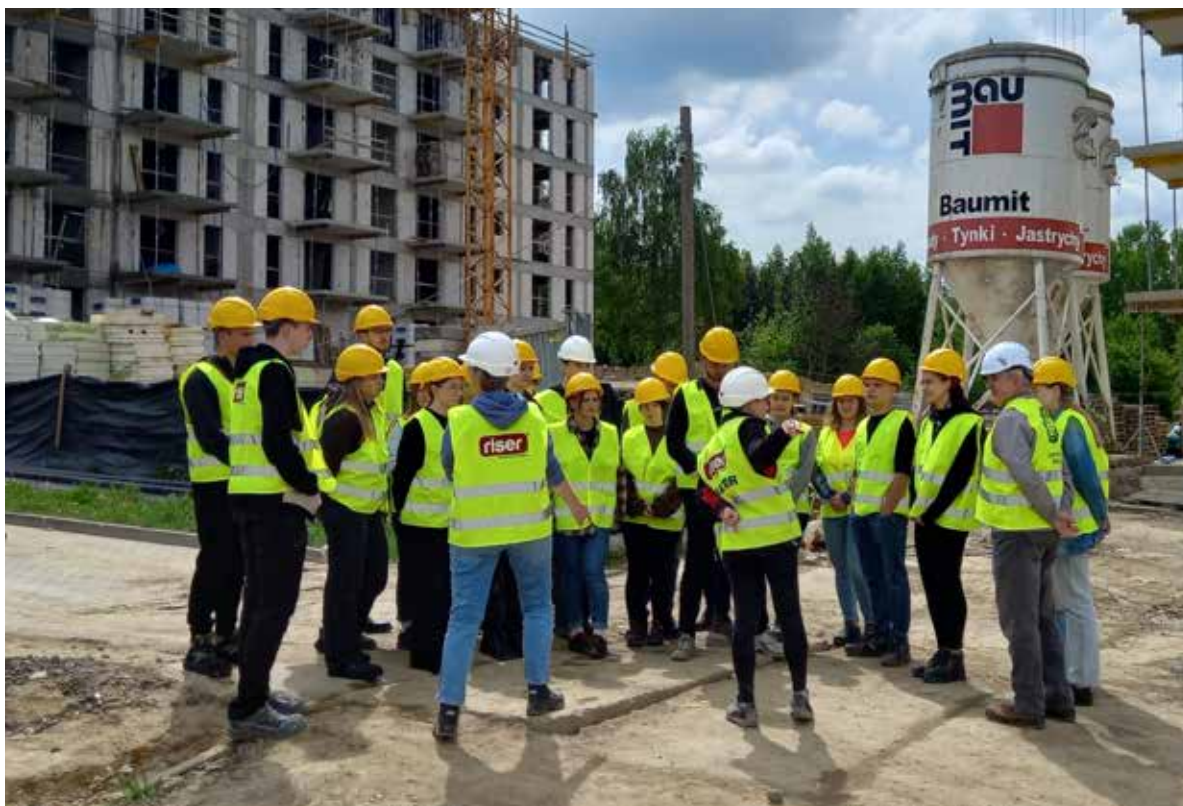
Fot. 18. Kształcenie przyszłych specjalistów możliwe jest tylko wtedy, kiedy teorię uda się połączyć z praktyką

Jeszcze dwie dekady temu dyplom uczelni był synonimem dobrej przyszłości – gwarantował społeczny prestiż oraz stabilną sytuację zawodową. Dziś coraz większe znaczenie mają umiejętności, doświadczenie i gotowość do działania. Pracodawcy poszukują osób, które nie tylko znają teorię, ale przede wszystkim potrafią zastosować ją w praktyce. Liczą się interdyscyplinarność, elastyczność i zdolność szybkiego reagowania na zmieniające się realia. Aby edukacja zawodowa nadążała za potrzebami rynku, konieczna jest ścisła i długofalowa współpraca między biznesem a instytucjami kształcenia. To właśnie na styku tych dwóch obszarów rodzą się rozwiązania, które realnie wpływają na przyszłość młodych ludzi.