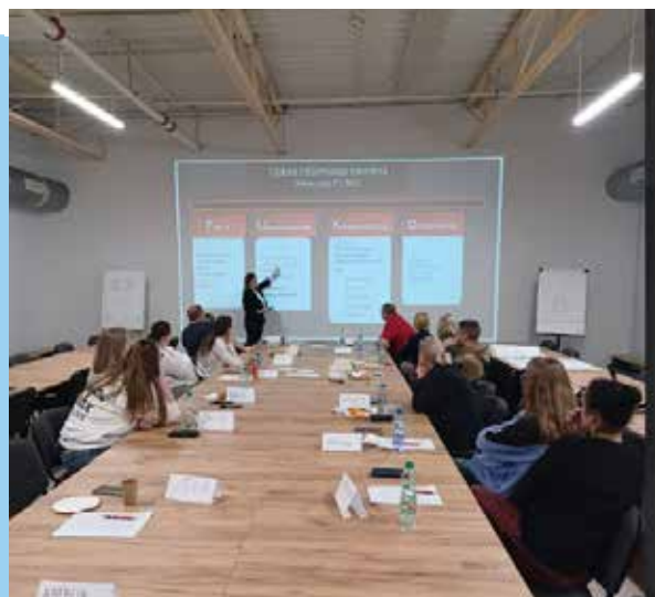
Fot. 21. Sieć Badawcza Łukasiewicz Instytut Ciężkiej Syntezy Organicznej „Blachownia” zaprosił najmłodszych na warsztaty chemiczne