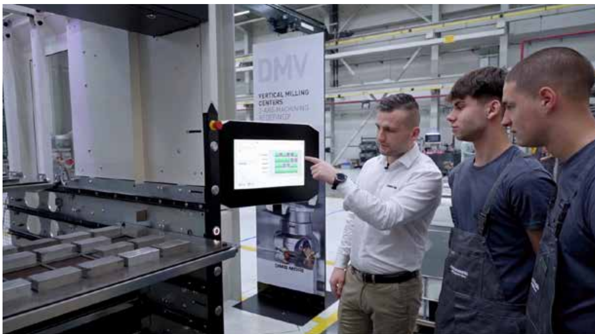
Fot. 10. Uczniowie pracują na nowoczesnym sprzęcie i uczą się od doświadczonych specjalistów (fot. archiwum laureata)

Wdrożenie programu nie obyło się bez wyzwań – różnice w tempie działania szkół i firm, brak odpowiedniego zaplecza technicznego czy kadry z aktualnym doświadczeniem branżowym, to tylko niektóre z nich. Dlatego firma powołała zespół przygotowujący uczniów do pracy zawodowej. Pracownicy przeszli specjalistyczne kursy lub podjęli studia pedagogiczne, finansowane przez firmę.