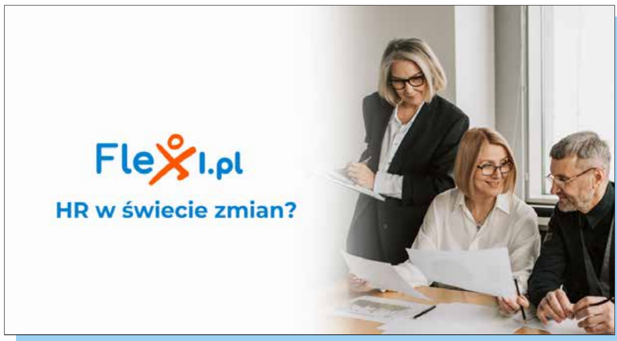
Fot. 12. Na platformie można znaleźć oferty pracy, wolontariatu, ale również wydarzenia kulturalne czy inicjatywy Uniwersytetów Trzeciego Wieku

Z takim właśnie celem powstał portal Flexi.pl – skierowany do osób aktywnych po 50. roku życia. Inicjatywa promuje wartość doświadczenia zawodowego, buduje świadomość społeczną i tworzy przestrzeń rozwoju dla osób w wieku dojrzałym. Na platformie dostępne są oferty pracy, wolontariatu, wydarzenia kulturalne oraz inicjatywy Uniwersytetów Trzeciego Wieku. Flexi.pl publikuje również poradniki, artykuły lifestyleowe i wywiady z osobami, które łamią schematy i pokazują, że dojrzałość to siła.