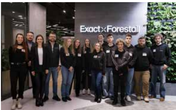
Fot. 38. Uczestnicy otrzymują wsparcie finansowe oraz możliwość rozwoju poprzez praktyki i staże studenckie

Do tej pory firma przyznała stypendia 37 osobom, inwestując w ich rozwój ponad 600 tys. zł. Trwa nabór do edycji 2025/2026. Program stypendialny to część szerokiej strategii edukacyjnej Grupy – obok projektu „xAcademy”, w ramach którego tysiące młodych osób zdobyło kompetencje w zakresie metod kontroli jakości w zakładach produkcyjnych. Exact jako pierwszy w branży wdrożył też całkowicie zdalny proces rekrutacji i szkoleń adaptacyjnych.