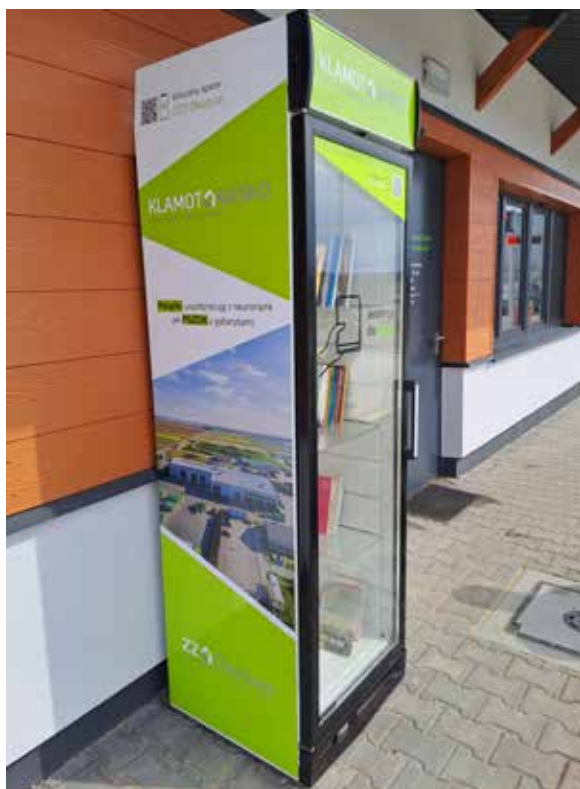
Fot. 43. Kampania przynosi efekty. W gminach rośnie poziom odzysku, a mieszkańcy przywiązują większą wagę do selektywnej zbiórki odpadów