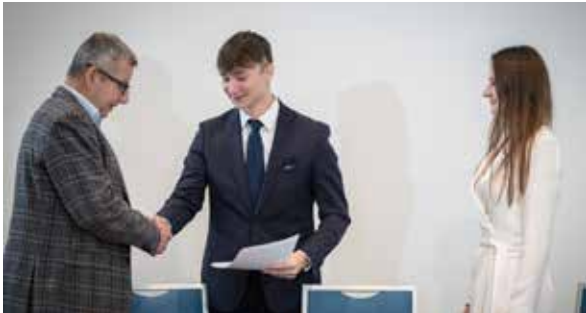
Fot. 37. Jak dotąd, stypendium przyznano 37 osobom

zatrudnionych w polskiej spółce. W drugiej edycji rozszerzyliśmy kryteria kwalifikacji – otworzyliśmy program na znacznie szersze grono studentów, zwiększając tym samym jego oddziaływanie – podkreśla.