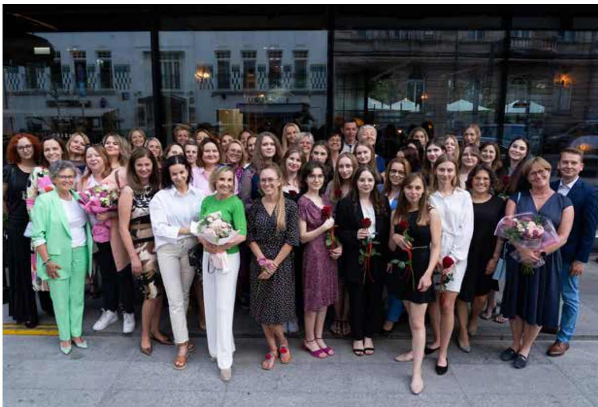
Fot. 22. Na rynku pracy pojawia się coraz więcej inicjatyw wspierających kobiety, na przekór stereotypom i uprzedzeniom